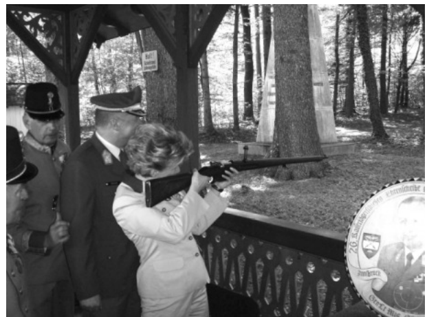
Unsere Bürgermeisterin – nicht nur beim Schießen unerschrocken