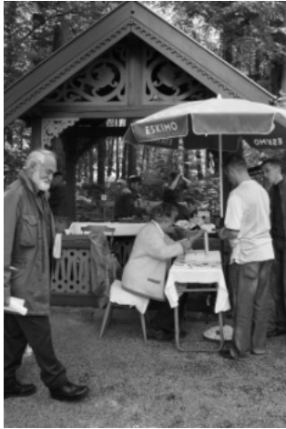
Reger Betrieb auch am Pistolenstand