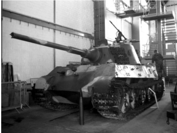
Der Tiger II – „Königstiger“ im Schweizerischen Militärmuseum Full

Aufbau befindliche Museum gab. Mit besonderem Stolz wurde aber verkündete, daß alle gezeigten Exponate, wie es Schweizer Tradition entspricht, voll funktionsfähig sind. Größtes Interesse rief ein Königstiger hervor, der dem Museum vor kurzem zugegangen ist.