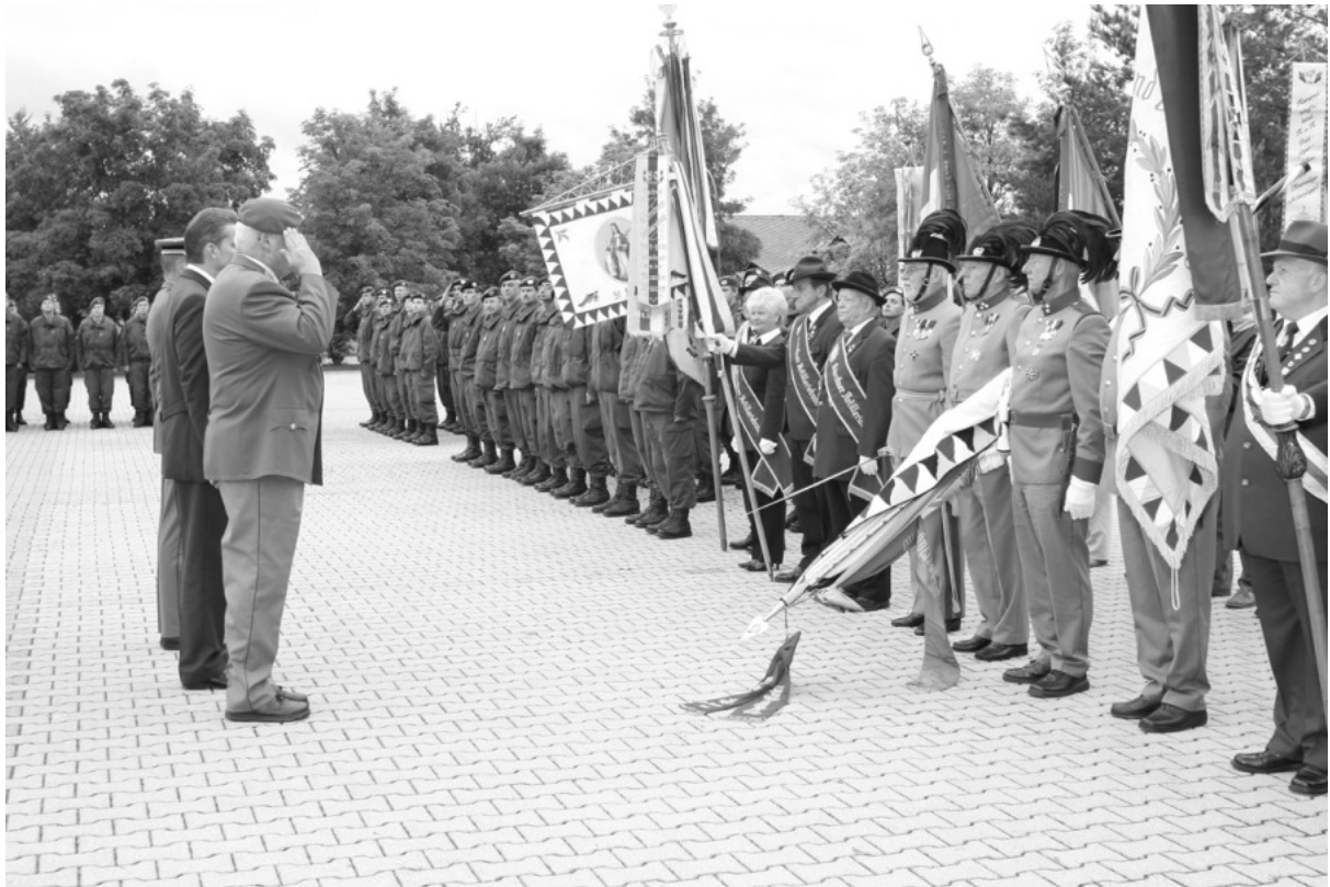
Traditionstag bei der 7. Jägerbrigade in Klagenfurt