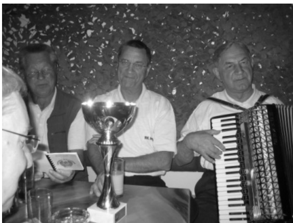
Kameraden der RK- Hörden