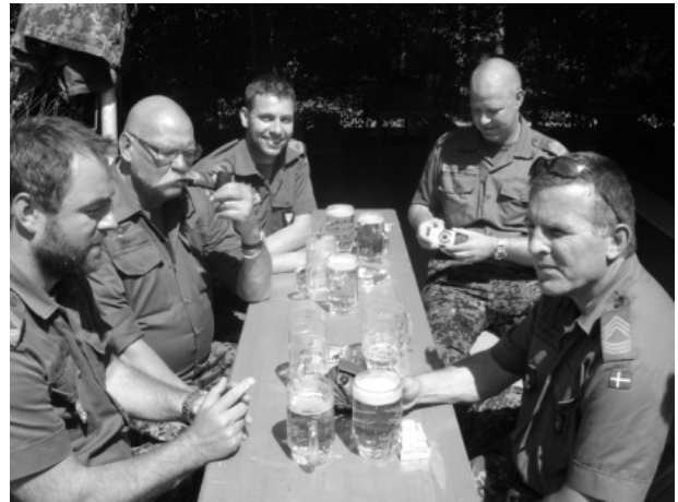
Die dänische Leibgarde