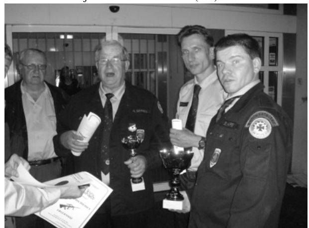
Dresdner Militär- und Polizeischützen